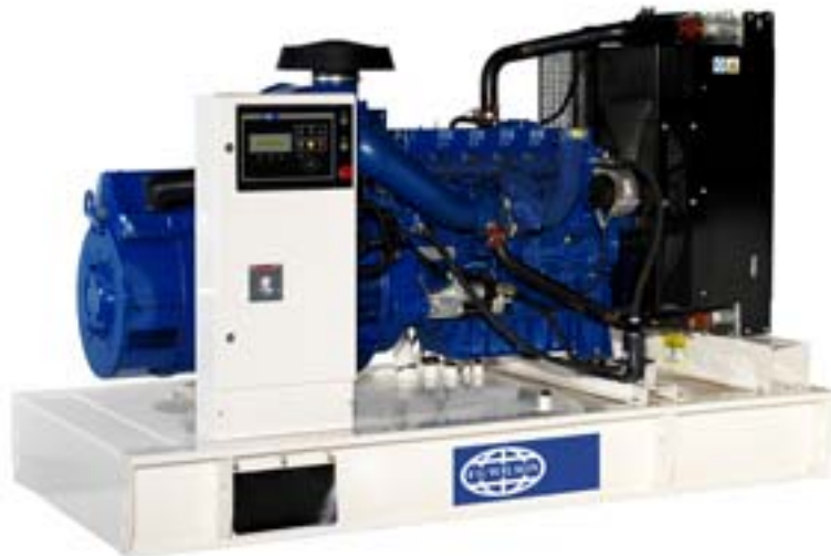
Рисунок приведен исключительно с иллюстративной целью