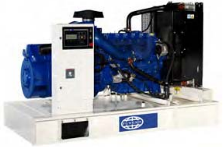
Рисунок приведен исключительно с иллюстративной целью